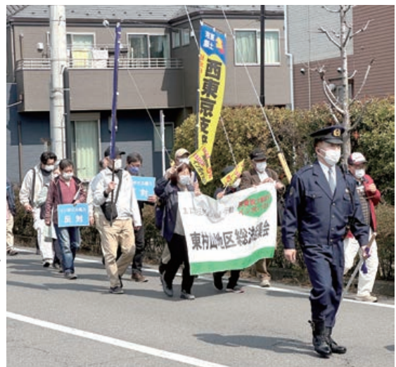
東村山税務署に向けてデモ行進