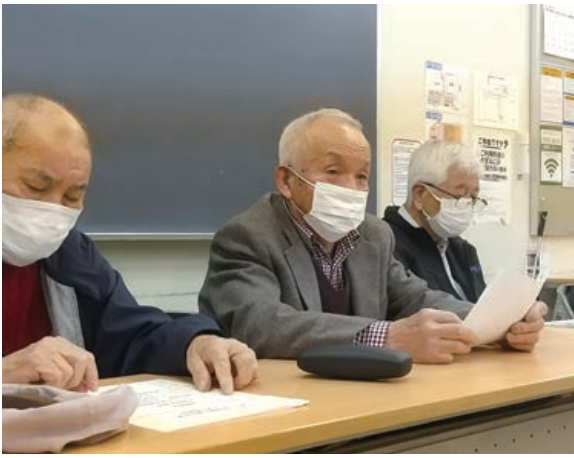
発言する笹下シニア友の会会長

3月9日、東久留米生涯学習センターにてシニア友の会総会が行われました。会員には書面配布を行いました。