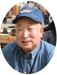
古名新会長からのあいさつ

今年度家族や仲間のみなさんに支えられてここまでできました事に感謝の意を込めて、心新たに3年間、会長の役を務めさせていただきます。金も力もありませんが、シニアという事を忘れず、無理をせずにがんばりますのでよろしくおねがいします。